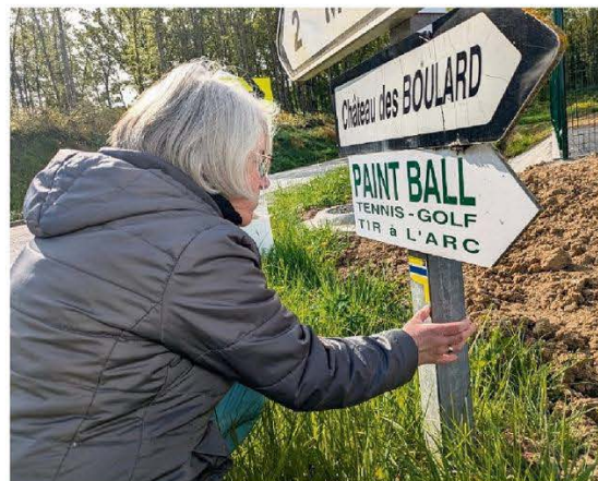
Les baliseurs ont parcouru le chemin sur une quarantaine de kilomètres.

En plus de se retrouver lui-même au bout du chemin, l'expérience l'a « réconcilié avec les autres »